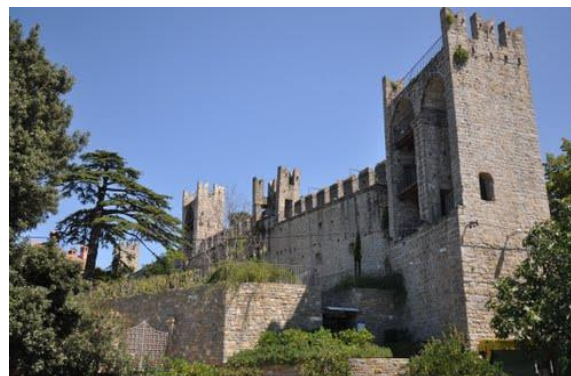
Le mura del XIV secolo