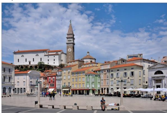
Piazza Tartini Cisterna