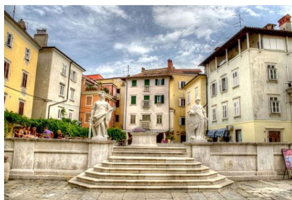
Piazza 1° maggio e della