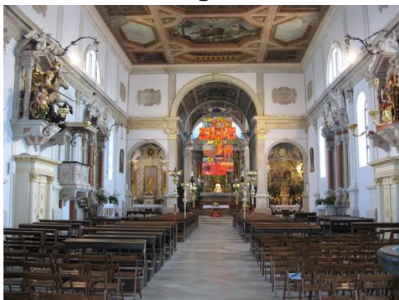
Duomo di San Giorgio e museo