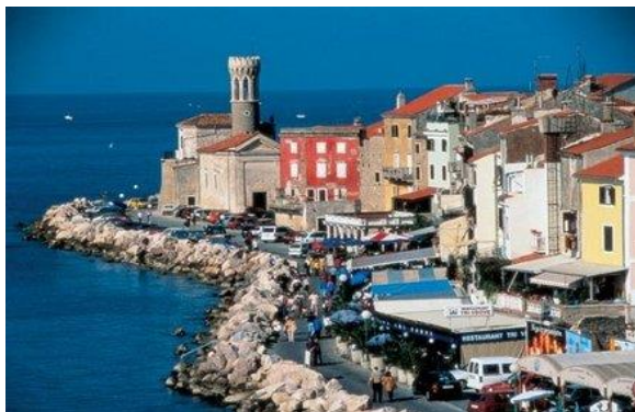
La Punta con la Torre Faro merlata