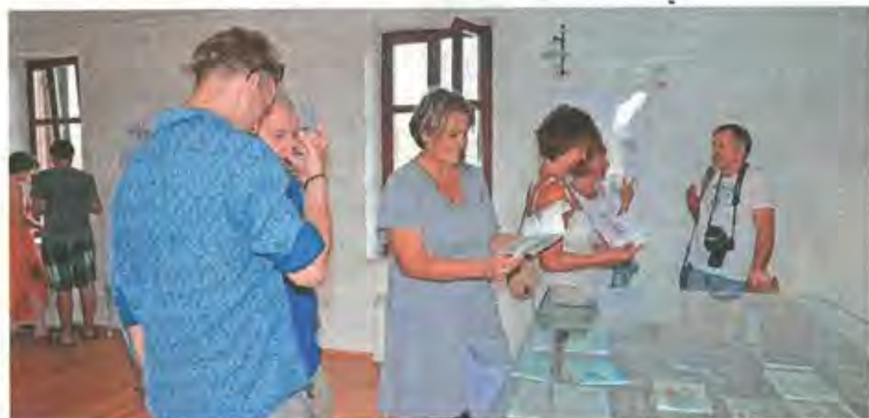
La mostra nel Casermone

tipico carnet di viaggio". I lavori che si possono ammirare sono di eccellente qualità e riuniscono la pittura alle parole, dando vita a dei veri e propri diari di viaggio, dimostrando come artisti stranieri e nostrani percepiscano e interpretino la peculiarità dell'ambiente locale. L'associazione di Mestre porta avanti da alcuni anni questo progetto artistico ispirato al mondo dell'acqua, avendo in passato già utilizzato proprio il Risano quale fonte d'ispirazione, mentre nel 2016 si auspica di proseguire arrivando fino al Dragogna. "Matite in Viaggio", nata nel 2011 con la prima esposizione di carnet di viaggio, si propone di promuovere e favorire l'interesse per i viaggi, mirando all'ampliamento della conoscenza dell'altro e della consapevolezza di sé. Un viaggiare quindi, che esula dalla moderna abusata fruizione consumistica di mezzi e luoghi, optando per una dimensione del viaggio più articolata e come profonda esperienza esistenziale. (jb)