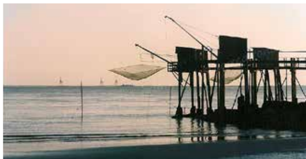
les carrelets et l'estuaire / i « carrelets » e l'estuario

FIN DE JOURNÉE : Apéro face à l'Atlantique FINO DEL GIORNO: Aperitivo di fronte al' Atlantico