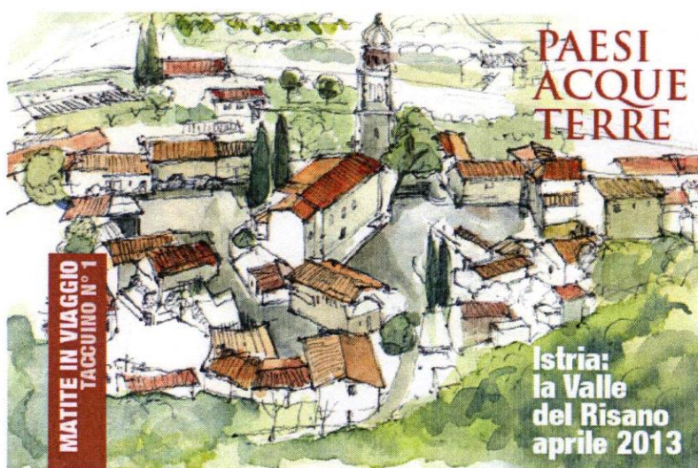
CARNET A PIÙ MANI DURANTE IL VIAGGIO ALLA VALLE DEL RISANO (2013)

Il 2013 e il 2014 hanno visto i carnettisti partecipi all'evento promosso da Matite in Viaggio sul tema "Paesi Acque Terre", dando vita a 2 taccuini che "narrano", con disegni e parole, i territori dell'Istria e del Carso.